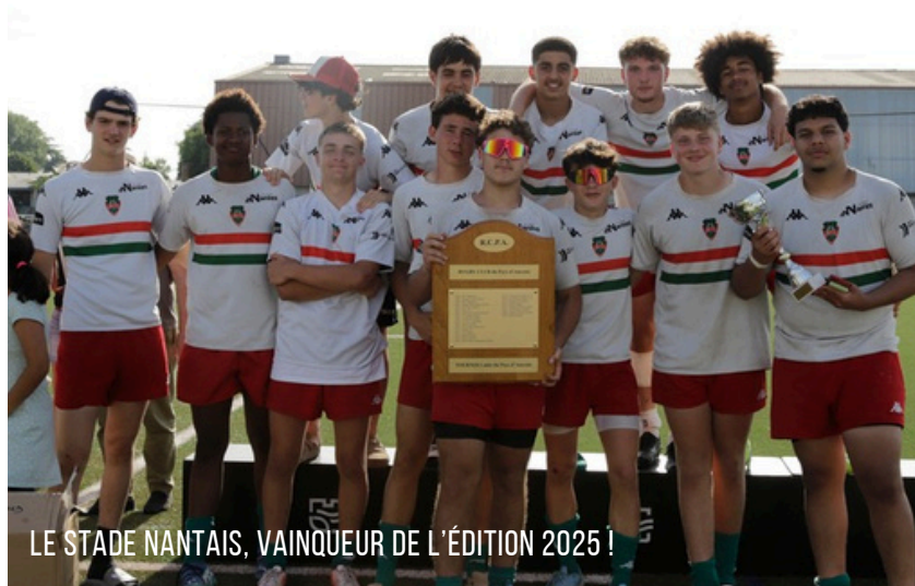
LE STADE NANTAIS, VAINQUEUR DE L'ÉDITION 2025 !