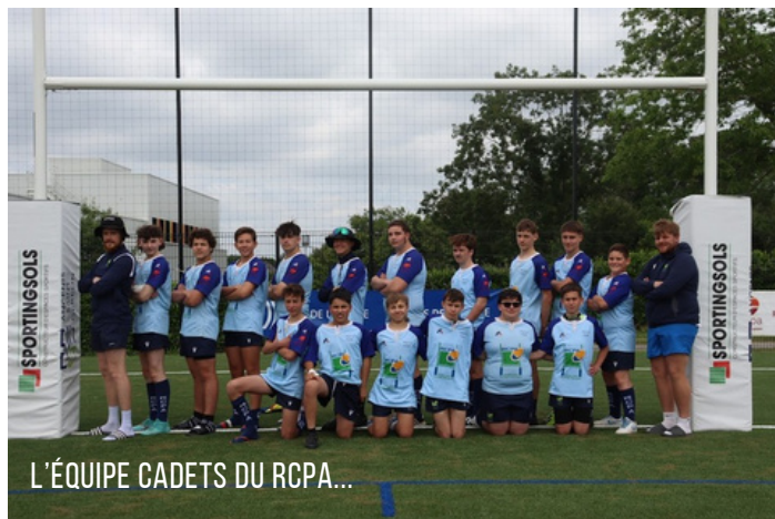
L'ÉQUIPE CADETS DU RCPA...