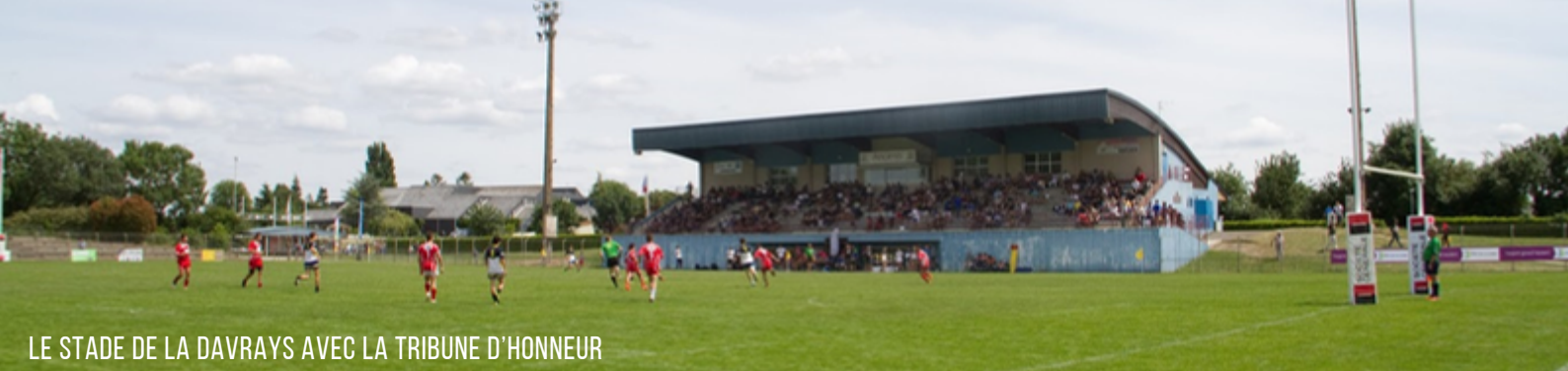
LE STADE DE LA DAVRAYS AVEC LA TRIBUNE D'HONNEUR