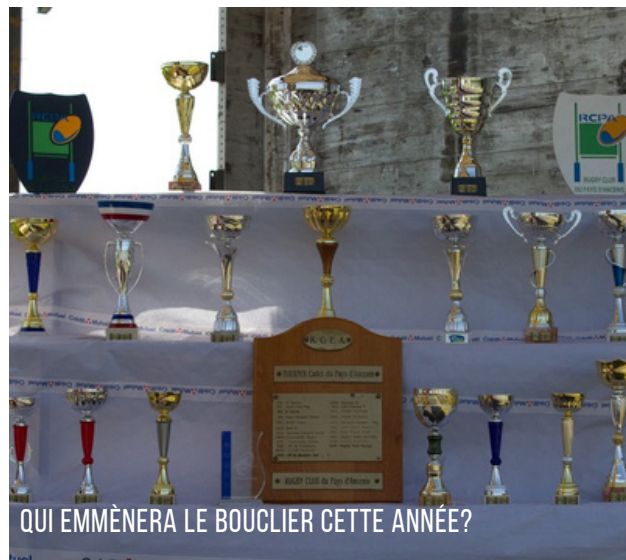
QUI EMMÈNERA LE BOULIER CETTE ANNÉE?