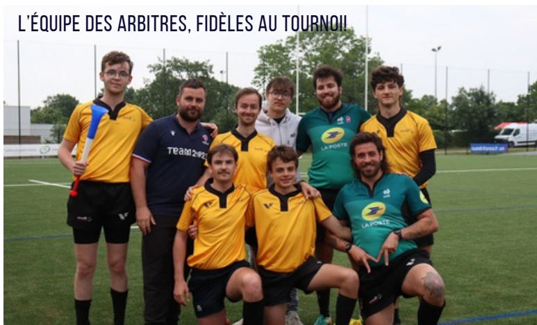
L'ÉQUIPE DES ARBITRES, FIDÈLES AU TOURNOI