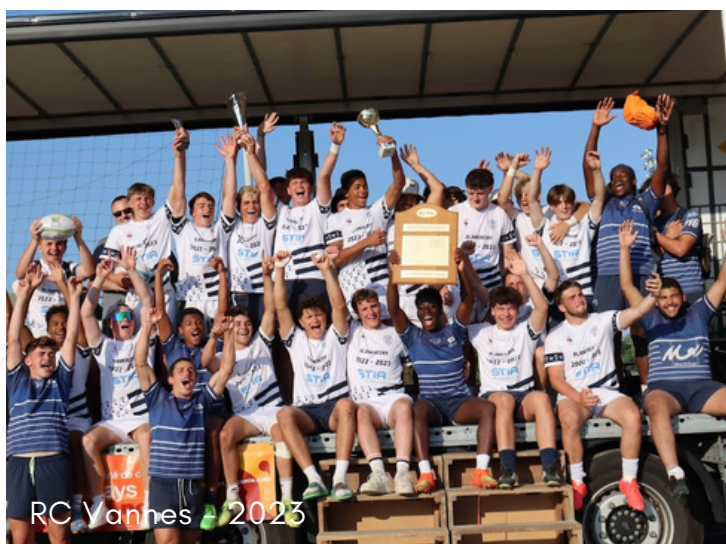
RC Vannes - 2023