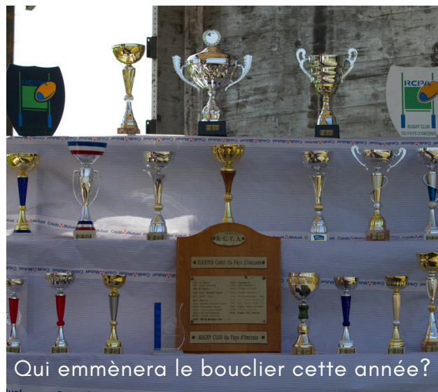
Qui emmènera le bouclier cette année?