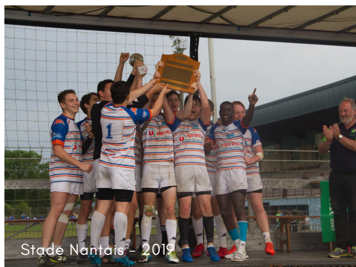
Stade Nantais - 2019