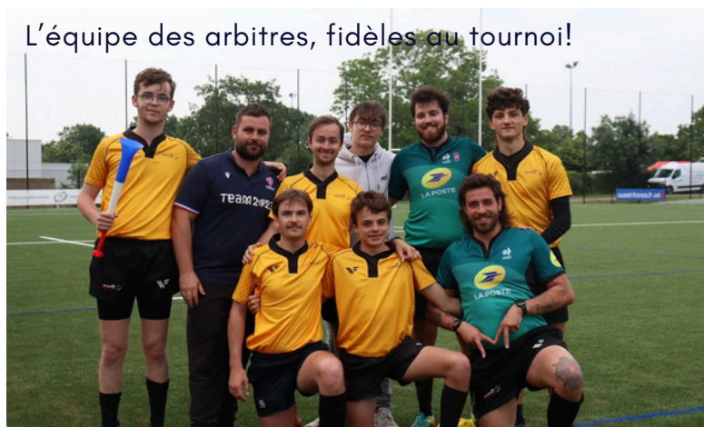
L'équipe des arbitres, fidèles au tournoi!