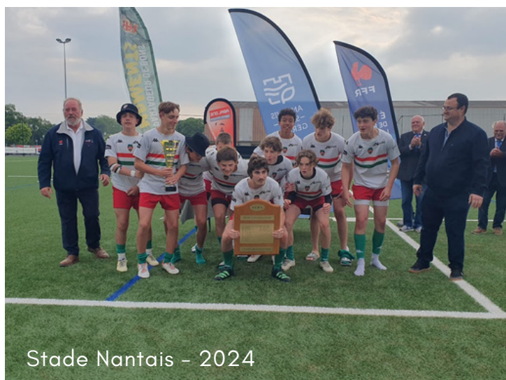
Stade Nantais - 2024