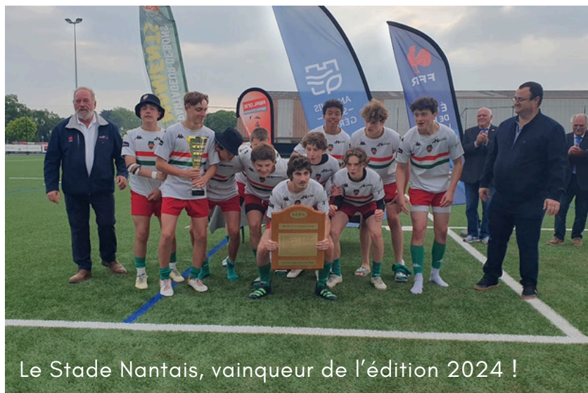
Le Stade Nantais, vainqueur de l'édition 2024 !