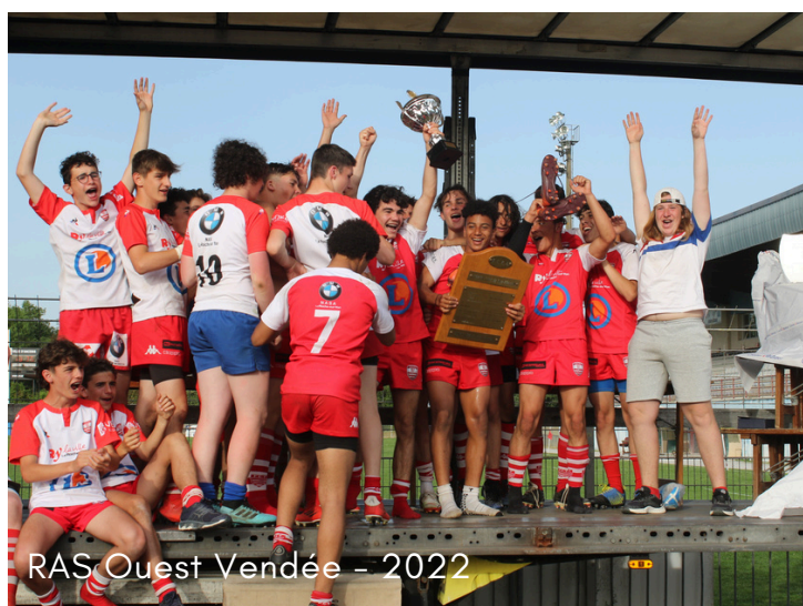
RAS Ouest Vendée - 2022