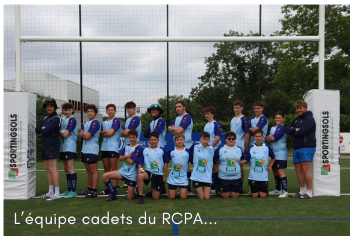
L'équipe cadets du RCIPA...