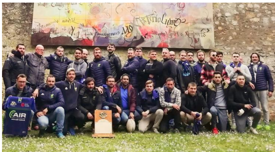
Le groupe séniors lors de la remise des maillots avant le match de 32 ème de finale FFR 2 ème série.