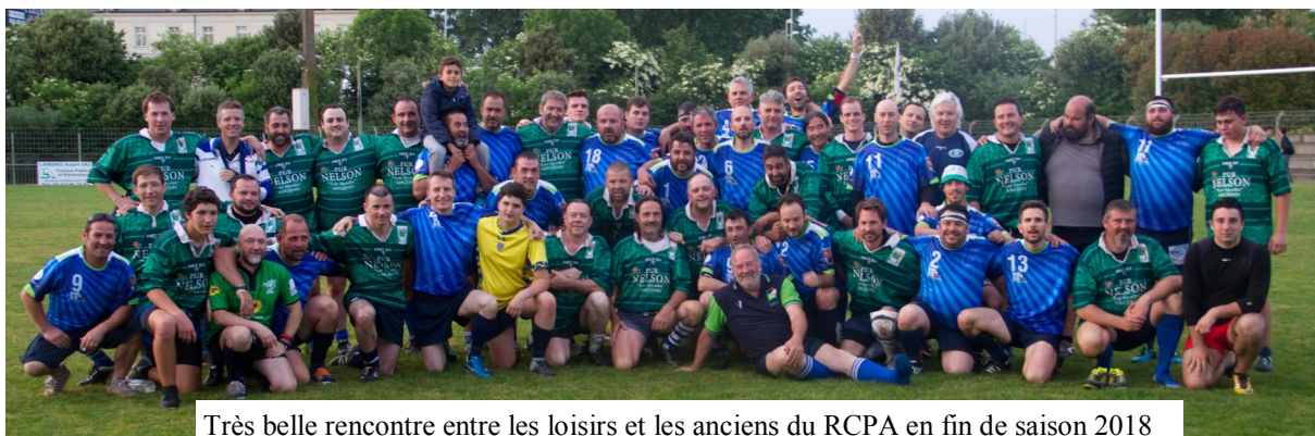
Très belle rencontre entre les loisirs et les anciens du RCPA en fin de saison 2018

Pour parler maintenant de choses beaucoup « festives » nous vous invitons à prendre contact très vite avec nos dirigeants bénévoles pour réserver votre soirée du samedi 2 février prochain . Le RCPA organise sa traditionnelle « soirée du club », permettant à tous les membres, amis, familles et proches du club de se retrouver dans une ambiance « 3° mi-temps » toujours aussi conviviale ( info en pages intérieures).