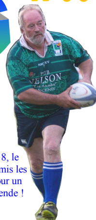
Fin mai 2018, le président a remis les crampons pour un match de légende !