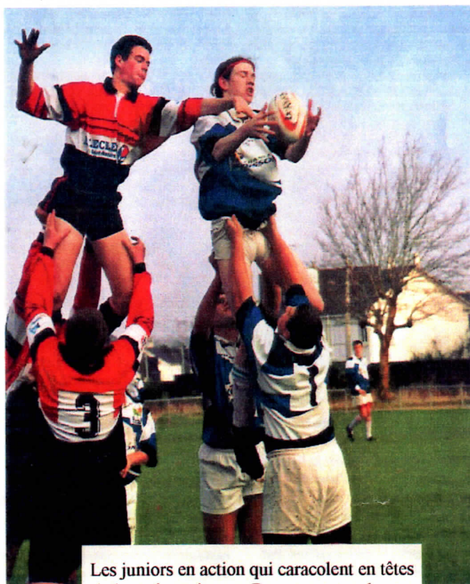
Les juniors en action qui caracolent en têtes de leur championnat. Pourvu que ça dure et vivement le championnat de France