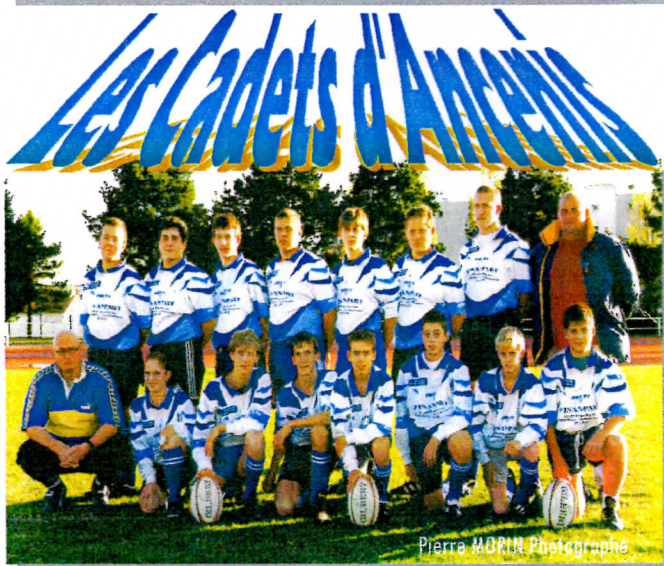
Pierre MORIN Photographe