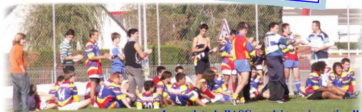
Les cadets de l'ASC en pleine préparation !!