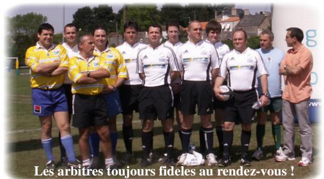
Les arbitres toujours fideles au rendez-vous !