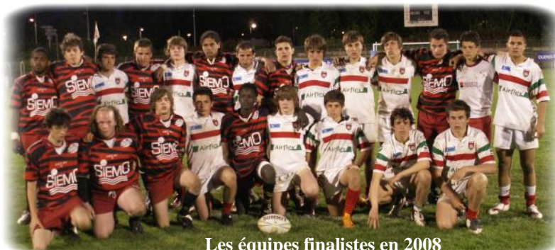
Les équipes finalistes en 2008