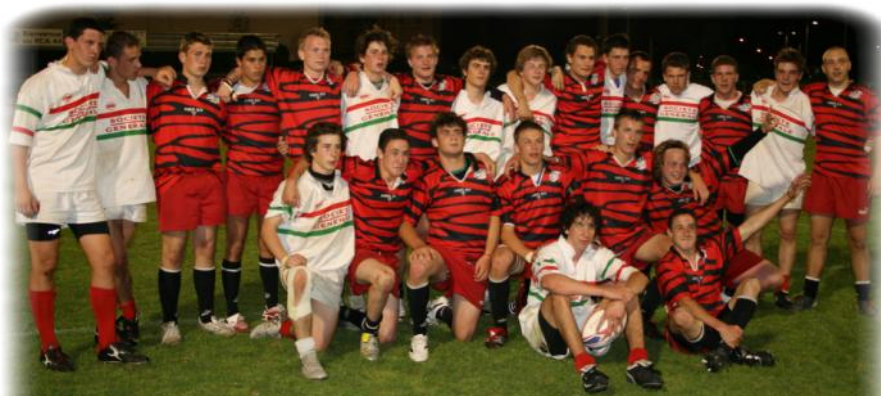
SNUC et XV de l'Atlantique avant la finale Challenge Société Générale 2007

Alors, messieurs les joueurs ... bonne chance à tous ... et bonne route aux meilleurs d'entre vous vers Lille pour le week-end du 31 Mai et 1 er Juin ! Nous serons attentifs à vos résultats.