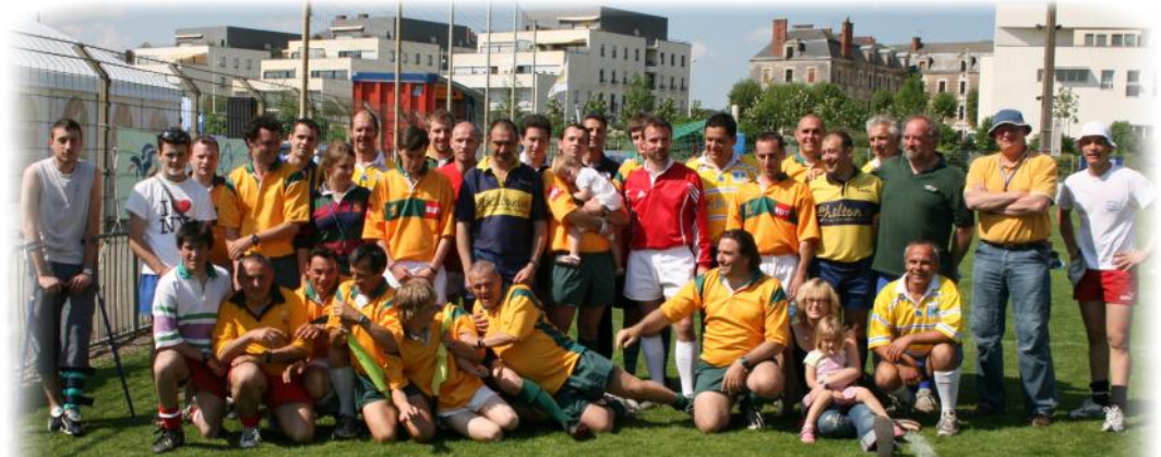
De la bonne humeur toute la journée et particulièrement pour la traditionnelle photo !!!

Et s'il ne s'agissait que de parler de sport ! Mais il s'agit de bien autre chose ! Car l'« Arbitre Circus » ne se déplace pas sans une caravane d'accompagnatrices et de petits accompagnateurs qui, tournoi après tournoi, ne cesse de