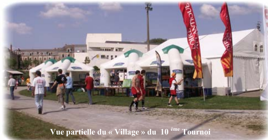
Vue partielle du « Village » du 10 ème Tournoi