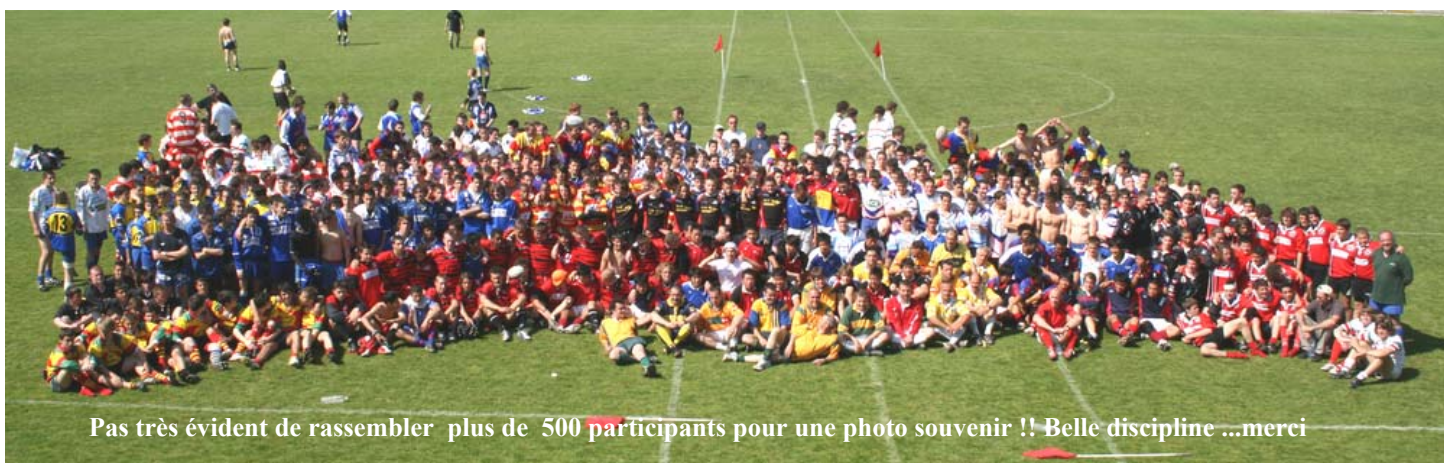
Pas très évident de rassembler plus de 500 participants pour une photo souvenir !! Belle discipline ...merci