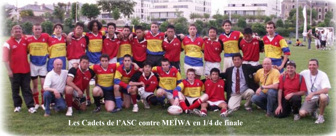
Les Cadets de l'ASC contre MEIWA en 1/4 de finale