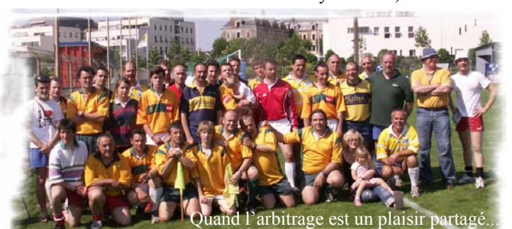
Quand l'arbitrage est un plaisir partagé...

Alors rendez-vous le Samedi 3 Mai 2008.. Peut-être à La Davrays ? Allez, chiche !!