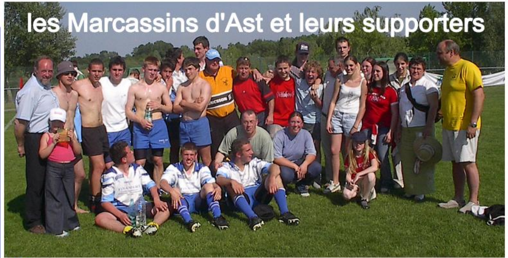
les Marcassins d'Ast et leurs supporters