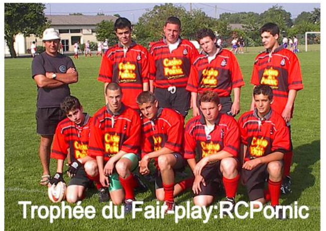
Trophée du Fair-play: RCPornic