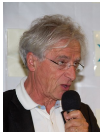
M. Tobie: Mairie/Compa