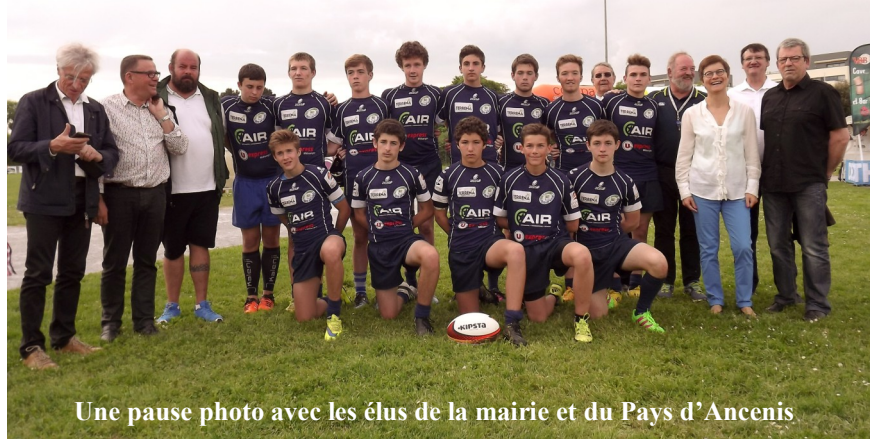
Une pause photo avec les élus de la mairie et du Pays d'Ancenis

Bonne prestation de nos cadets dans la première phase du tournoi mais un peu plus de difficultés dans le second tableau plus relevé. Belle 8 ème place !!!