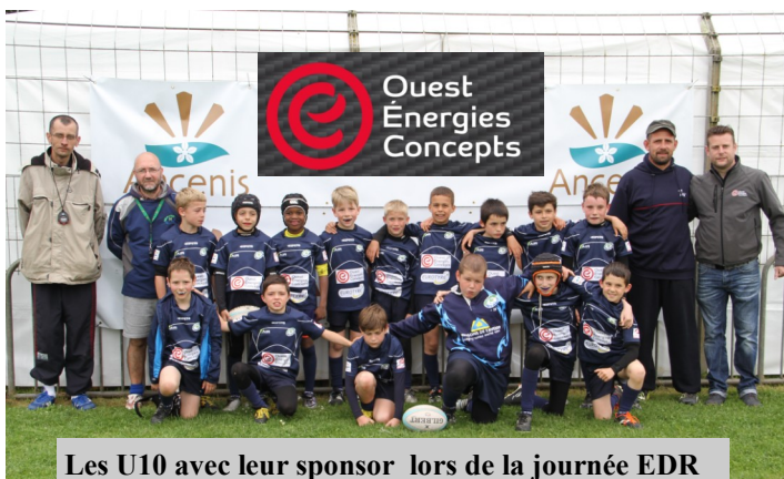
Les U10 avec leur sponsor lors de la journée EDR

Il y aura sans doute des changements à prévoir, car au cours de cette AG 2016, le