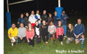
Rugby à toucher