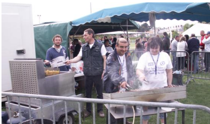
Les bénévoles très motivés...