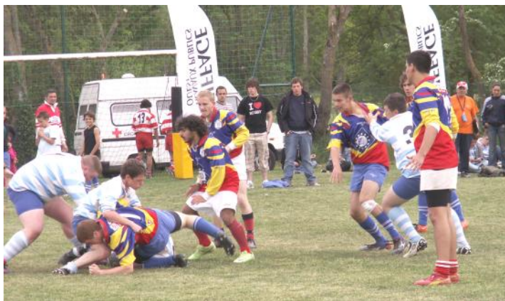
Des duels spectaculaires...