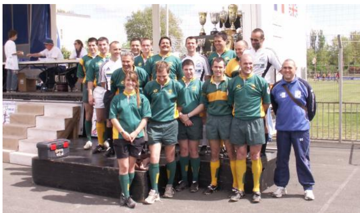
Les arbitres, partenaires indispensables...