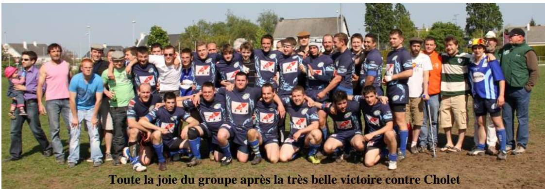
Toute la joie du groupe après la très belle victoire contre Cholet